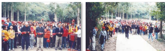
香港神學院 五十周年院慶活動－ 大潭水塘步行籌款剪綵、開步禮