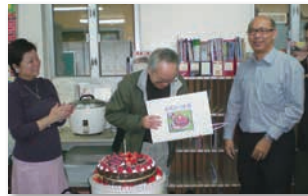
歷年師生敬賀 院長生日聚會