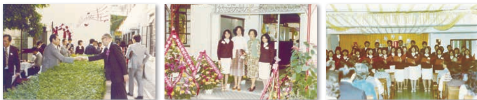
香港神學院 三十周年院慶活動